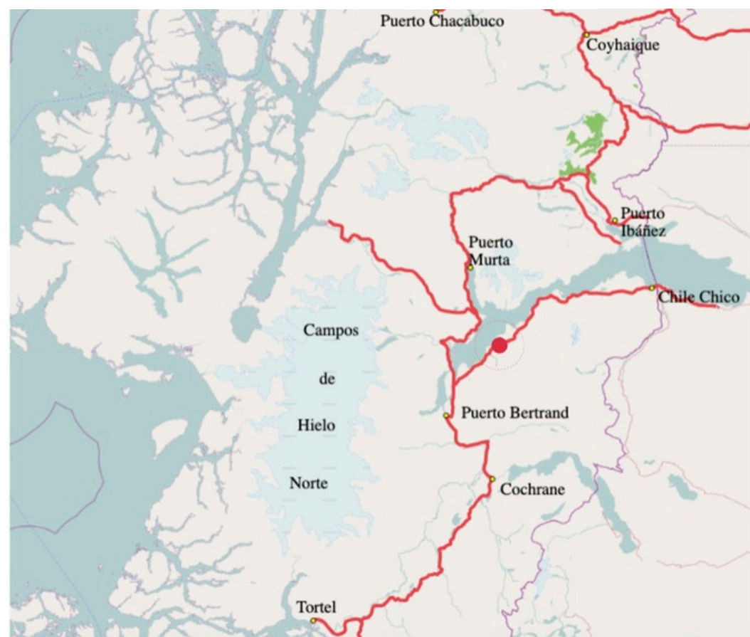
Ubicada entre los Campos de Hielo Norte y el Parque Patagonia.