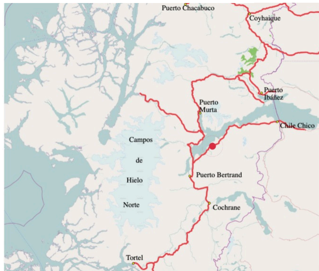
Ubicada entre los Campos de Hielo Norte y el Parque Patagonia.