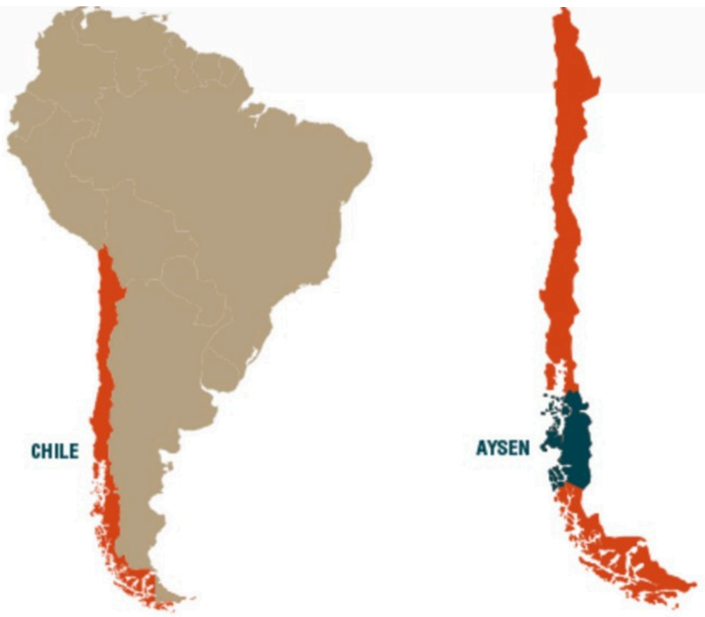
Región de Aysén, Patagonia Chilena.